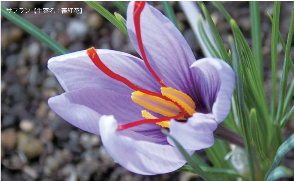
サフラン【生薬名：蕃紅花】